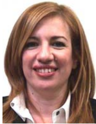
Fofi GENNIMATA (GR) Presidenta de la Prefectura de Atenas-Pireo