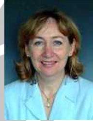
Irene OLDFATHER (UK) Diputada del Parlamento escocés