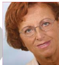
ECOS Breda PEČAN (SI) Alcaldesa de Izola