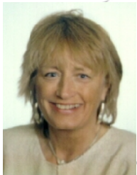
Catharina TARRAS-WAHLBERG (SE) Teniente de alcalde de la ciudad de Estocolmo