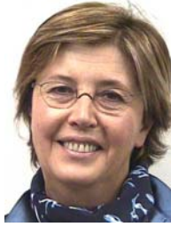
Presidenta Mercedes BRESSO (IT) Presidenta de la Región de Piamonte