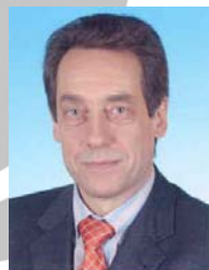
EDUC Gerd HARMS (DE) Representante del Estado federado de Brandeburgo ante el Gobierno Federal y para Asuntos Europeos