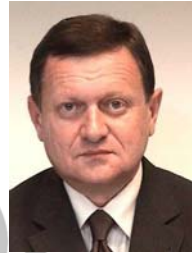
Michał CZARSKI (PL) Presidente de la Región de Silesia